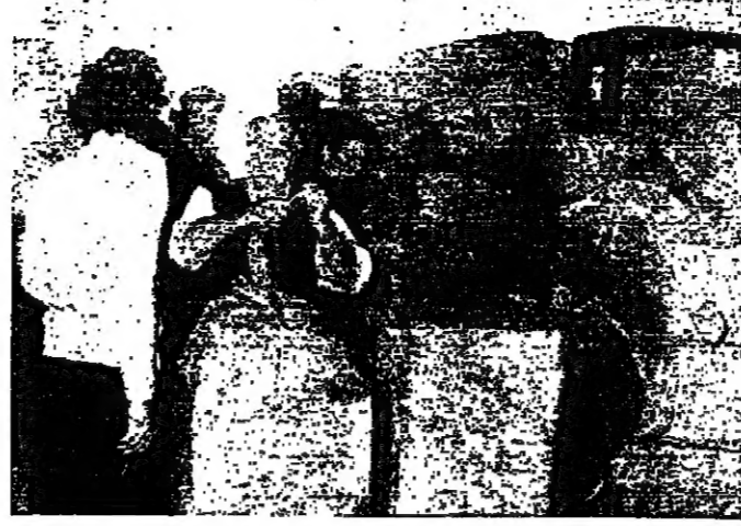
كيفية الحشيش يد مصاربتها